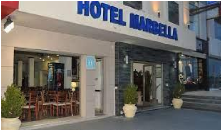
Hotel Marbella http://hotelmarbella.com.uy/