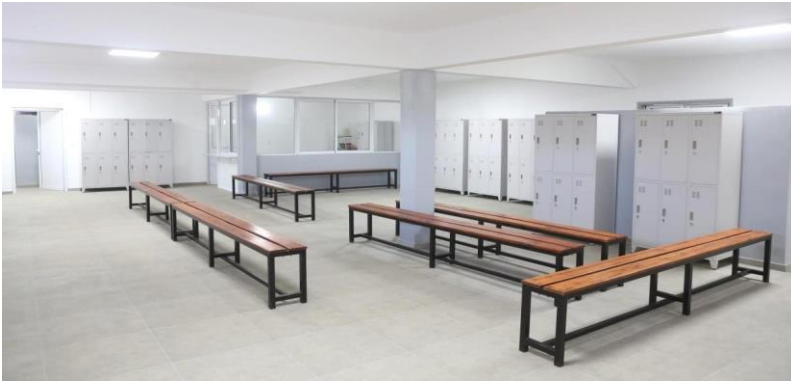
Cronometradores con Sistema Electrónico.